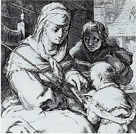
Linksboven: Een gravure van Cornelis Drebbel, waarop te zien is hoe een kind leert lezen.

Rechtsboven: Een ordonnantie uit 1667 die de Alkmaarse schoolmeesters en -meesteressen precies voorschrijft aan welke regels zij zich moeten houden bij het uitoefenen van hun beroep. Voordat ze met het lesgeven mogen beginnen, moeten ze een proeve van bekwaamheid afleggen; ze mogen elkaar niet beconcurreren door bijvoorbeeld het schoolgeld te verlagen en ze hebben plechtig moeten beloven zich aan deze voorschriften te zullen houden.